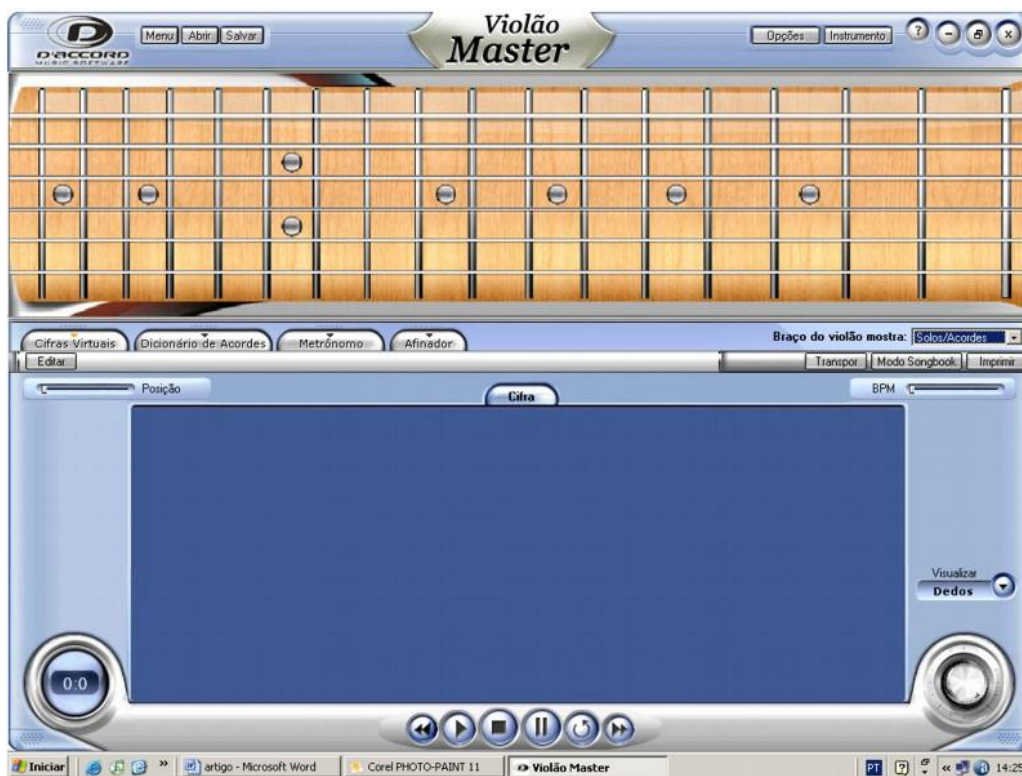
Tela do software “Violão Master”